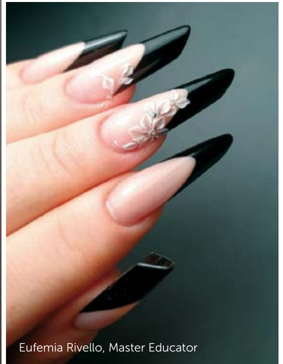
Eufemia Rivello, Master Educator

Xtreme Clear, Sens Acrygel Cover Pink, Royal Gel 6-7-21-74-32-88-138-79, 3Step Ice White, Art Gel Pro Black, Mattever e Top Cool.