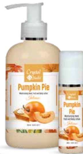
NOVITÀ! Pumpkin Pie 250 ml 5996487114314 € 9,08