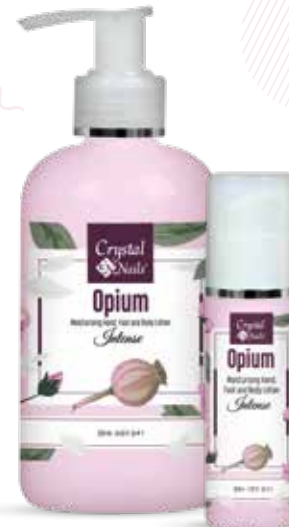
NOVITÀ! Opium 250 ml 5996487114277 € 9,08