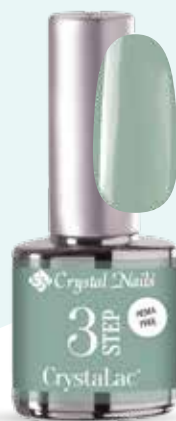
NOVITÀ! 3S248 Fanfare