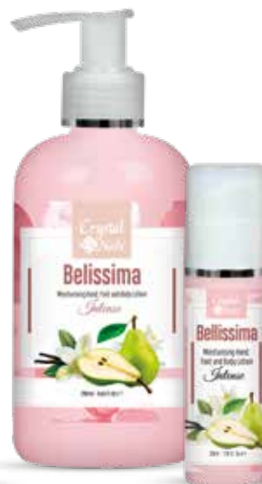
NOVITÀ! Bellissima 4 ml 5996487103646 € 2,50

I nostri oli per cuticole nutrono e proteggono le cuticole favorendo una crescita sana dell'unghia, mentre le nostre creme lasciano la pelle morbida, setosa e profumata, senza lasciare una sensazione untuosa.