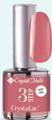
NOVITÀ! 3S249 Damson