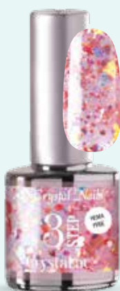
NOVITÀ! 3SD4 Hawthorn Glitter