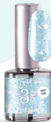
NOVITÀ! 3SD2 Sparkling Mint